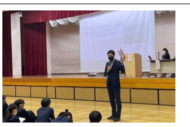
どの発表も興味深く、生徒からの質疑応答にも的確に答えるなど、活気あふれる発表会となりま